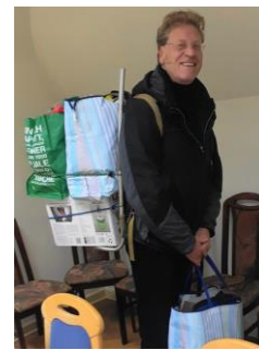
Spenden für Tombola