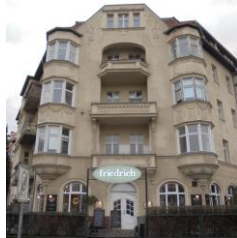
Kiezzrunde, 20.02.20, Restaurant Friedrich