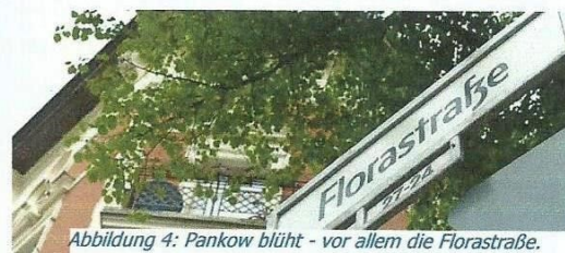
Abbildung 4: Pankow blüht - vor allem die Florastraße.

WebKiez organisiert eine regionale Wertschöpfung und trägt zu einer attraktiven Nachbarschaft bei. Hier schließen sich alle zusammen, die eine lebenswerte und individuelle Stadt, eine handlungsfähige Kommune, eine bunte Auswahl und Vielfalt an engagierten Geschäften und Dienstleistern und gute Arbeits- und Ausbildungsplätze wollen.