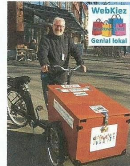
Abbildung 1 - KiezEngel Lieferservice

WebKiez bietet einen bequemen Einkaufsservice, einen lokalen Online-Marktplatz sowie eine nachhaltige Belieferung mit Elektrolastern. Beim Einkaufen bevorzugen wir die lokalen, inhabergeführten Geschäfte mit regionalem Warenangebot und liefern ohne Abgase und Staus weitestgehend verpackungs- und plastikfrei bis in die Küche. Die Lieferdienst-Mitarbeitenden - KiezEngel genannt - sind freundliche, orts- und sachkundige, fair bezahlte Dienstleister, die Empfehlungen für einen nachhaltigen Einkauf geben.