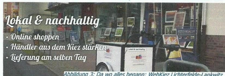
Abbildung 3: Da wo alles begann: WebKiez Lichterfelde-Lankwitz

WebKiez ist ein lokaler Online-Marktplatz für die inhabergeführten Geschäfte. Kunden können zu jeder Zeit Geschäfte finden oder auch ihren Wocheneinkauf online bestellen – die KiezEngel liefern alles aus allen Geschäften taggleich nach Hause. Das ist bequem, nachhaltig und fair.